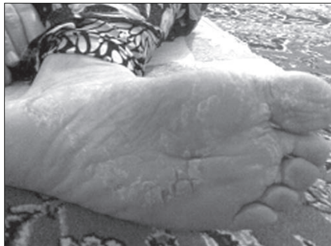
شکل ۳: ترک پا قبل از استفاده از کرم ۱ درصد بره موم (سمت راست) و ۱۴ روز بعد از استفاده از کرم (چپ)