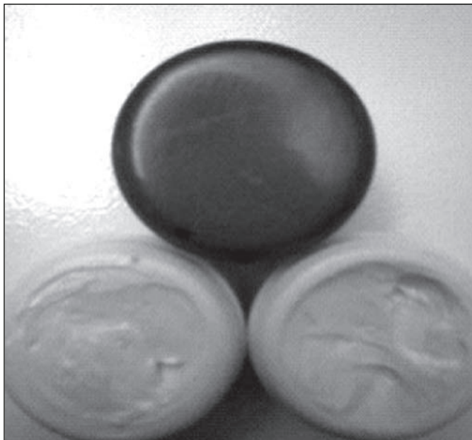
شکل ۲: کرم پایه (بدون بره موم)، کرم حاوی ۱ و ۳ درصد بره موم