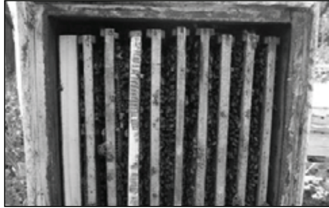
شکل ۴: استفاده از فضای ایجاد شده مابین انتهای شان ها و سطح توری به منظور محیط مناسب برای اضافه بافت بصورت نر بافی که در نهایت ایجاد تله کنه گیر را ممکن می‌سازد