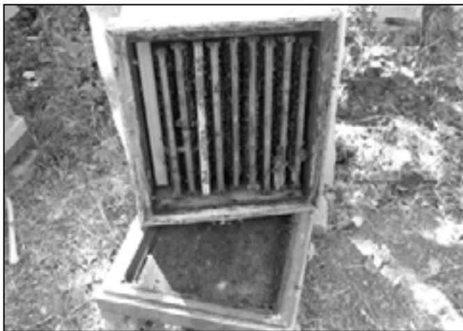
شکل ۳: نحوه‌ی قرار دادن بدنه بر روی پایه به منظور بازدید سریع کلنی از کف

قادرند با دور سازی پارازیت واروا از بدن خود کاهش سطح آلودگی قابل توجهی را در این سیستم از خود نشان دهد. (نتیجه‌ی بررسی و تحقیقات ۲۰۰۸ مرکز تحقیقات ایالت هسن کشور آلمان با مدیریت دکتر بوشلا بوده که در مجله‌ی پرورش زنبور عسل آلمان Bienenjournal درج شده بود)