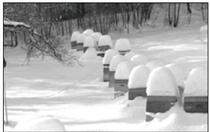
شکل ۷: زمستان گذرانی کلنی‌های کف باز در کشور آلمان