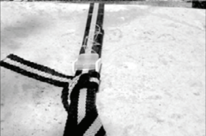
شکل ۵: نحوه‌ی استفاده از کمر بند مخصوص در حین کوچ و جابجایی زنبورستان

برخوردار خواهید شد. به این معنی که با ایجاد این فضا زنبورها در فصل موم بافی فراوان با ایجاد سلولهای نر بافت باعث جذب کنه‌ها به داخل این سلولها خواهند شد و می‌توان با بازید از کف کندو و استفاده از یک کاردک زنبورداری بدون اینکه درب کندو را باز نمود با تراشیدن این سلول‌های نریافت سر بسته شده تا ۵۰ درصد از کنه‌ها را بدون استفاده از دارو، از بین برد.