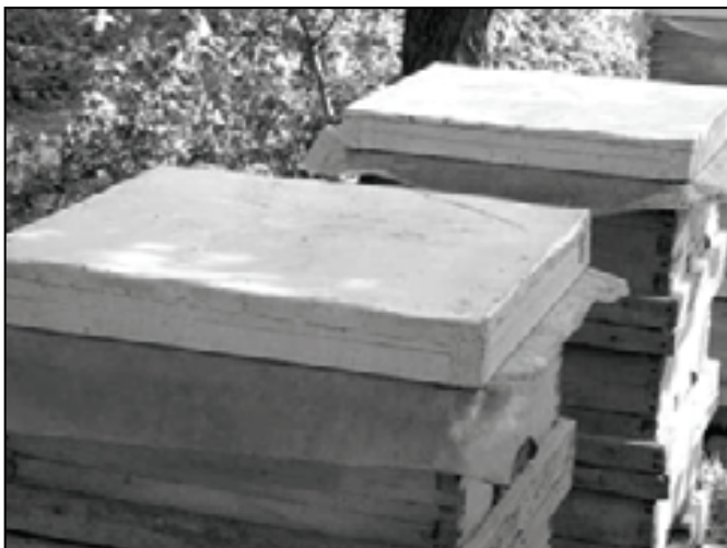
شکل ۲: استفاده از پلاستیک ضخیم در تمام فصول سال به عنوان مانع خروج هوا