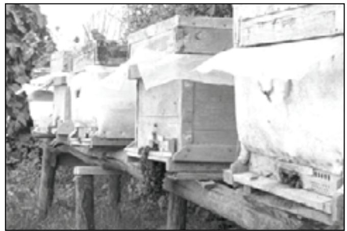
شکل ۶: خوشه بستن زنبورها در جلوی دریچه پرواز در کندوی معمولی و مقایسه آن با کندوی کف باز کناری