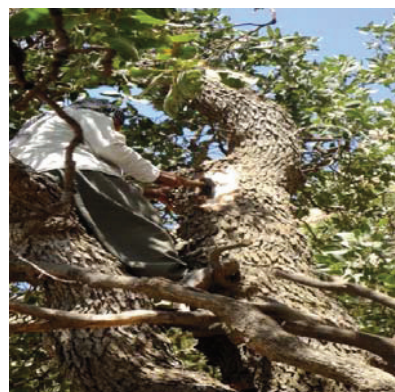
شکل ۱- شخص بهره‌بردار ایستاده بر روی لاوکه در حال تراشیدن چوب ساقه درخت

محصول ارزشمند دارد، علاوه بر این در روش برداشت اول که در نتایج آمده نیز برداشت کندو به طور کامل موجب صدمه به زنبورها و حتی شاید نابودی آن شود، در این مورد بهتر است که تمامی شانه‌ها برداشت نشود و چند عدد از آن‌ها باقی گذاشته شود تا تجدید دوباره کندو ممکن شود؛ ماگدوا [۲۹] به انجام این کار توسط افراد محلی بهره‌بردار در هند اشاره می‌کند و بیان می‌دارد که برداشت کنندگان دو تا پنج شانه را برای تجدید نسل باقی می‌گذارند، ولی در منطقه مطالعه چنین موردی مشاهده نشد. همچنین از عوامل کاهش جمعیت و نابودی زنبورهای عسل زمان برداشت نامناسب آن‌ها است که اگر نشود می‌تواند باعث مرگ و نابودی زنبورها شود.