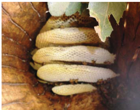
شکل ۳- کندو و نحوه قرارگیری شانه‌های آن درون ساقه درخت