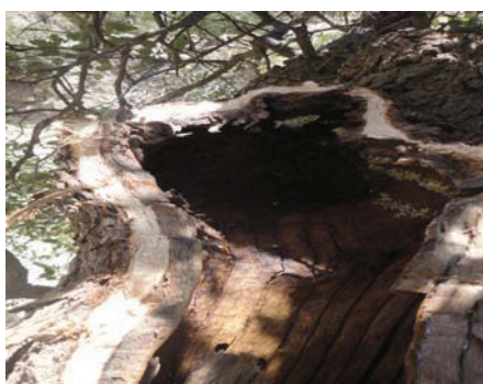
شکل ۴- محل کندو پس از بهره‌برداری

حال با توجه به این که شناخت و آگاهی از ارزش‌های نهفته در منابع جنگلی می‌تواند انگیزه حفاظت و احیای منابع طبیعی تجدید شونده را قوت بخشد [۱۶] امید است که با تحقیقاتی منسجم به موارد چون بررسی نقش زنبور عسل در گرده افشانی درختان جنگلی و بررسی خواص و ترکیب عسل کاملاً خالص نسبت به عسل پرورشی زنبورداران پرداخته شود تا ارزش هرچه بیشتر حضور زنبور عسل در جنگل مشخص شود، همچنین با آگاهی رسانی به مردم از رسانه به ویژه رادیو به منظور زمان مناسب برداشت، روش صحیح برداشت و اهمیت زنبور عسل در گرده افشانی درختان شاید بتوان گامی در جهت حفظ و بهره‌برداری پایدار از این محصول ارزشمند جنگلی برداشت.